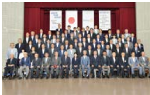
西三河分区分ガバナー補佐訪問 集合写真