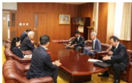
会長・幹事懇談会