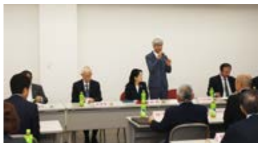
各委員長による委員会計画の発表とガバナー補佐のご指導