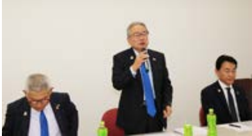
各委員長による委員会計画の発表とガバナー補佐のご指導