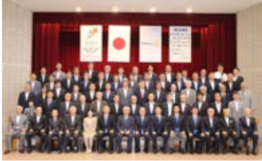
西三河分区ガバナー補佐訪問 集合写真