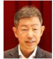
出口 達也 ロータリー財団委員長