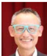
關 淳之 会員増強委員会