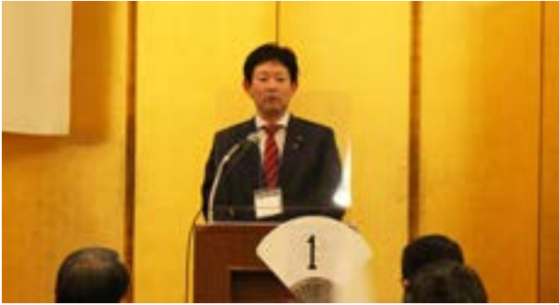
中村 健 西尾市長