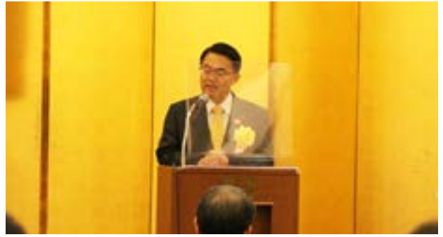
大村 秀章 愛知県知事