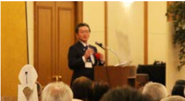
国際ロータリー第2760地区ガバナー 籠橋 美久