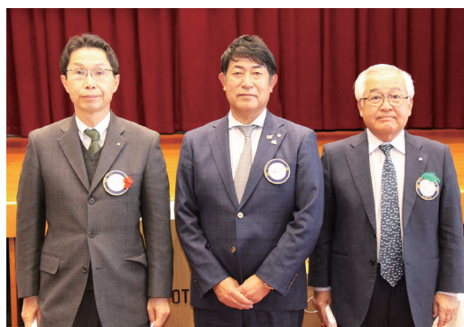
米山功労者に感謝状