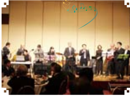
刈谷ロータリーバンド