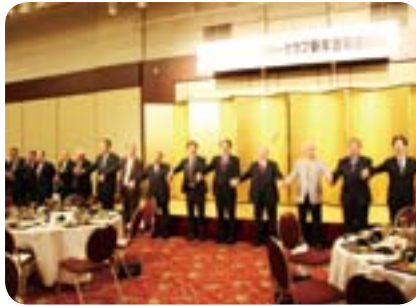
手に手をつないで