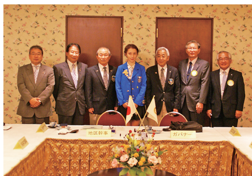
会長・幹事懇談会