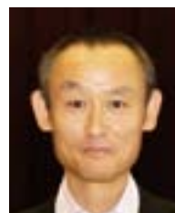
關 淳之 クラブ会報・IT委員会