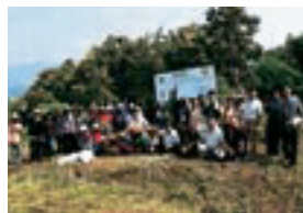
刈谷の森 (タイ・チェンライ)