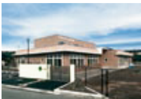
東日本大震災支援事業 (石巻ひがし保育園)