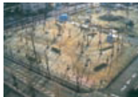
ロータリーの森 (刈谷市セントラルパーク)