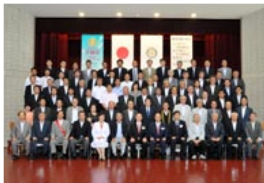
ガバナー補佐訪問 集合写真

また、来年2月には I.M. を担当させて頂きます。今年の I.M. は『友達を作ろう』というスローガンで成功されておりまして、私もスローガンを考えました。偶然目にした『思いを繋げよう』という文言を I.M. のスローガンにどうかと相談しました。I.M. の中で平和フォーラムをやりなさいと言われていて、メンバーの中で平和フォーラムにつながるのかという意見が出ましたが、平和というのは戦争などだけでなく、個の中にあるものという理解をして、I.M. を開催したいと思います。どうぞご協力をよろしくお願い致します。