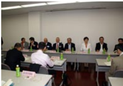
各委員長による委員会計画の発表とガバナー補佐のご指導