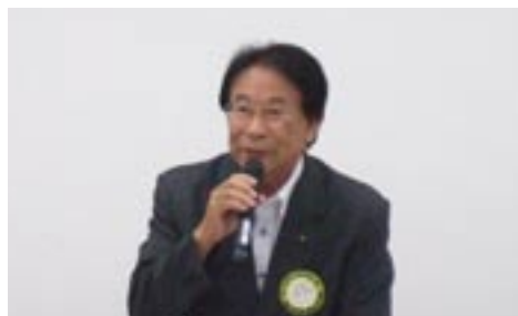
直前会長あいさつ