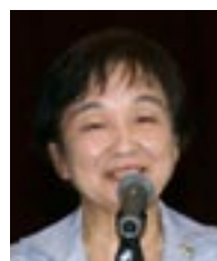
水越 彌生 ロータリー財団委員長