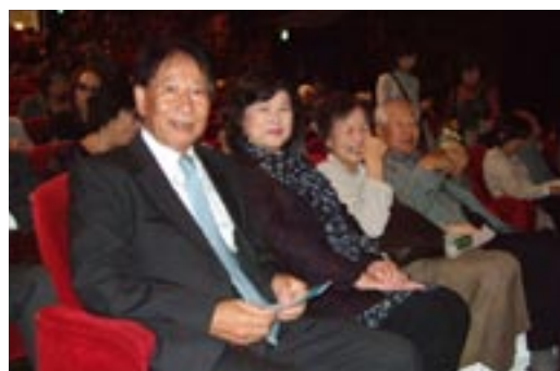
加トちゃん一座 旗揚げ公演