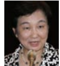
水越 彌生 ロータリー財団委員長