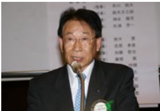
次期会長予定者あいさつ