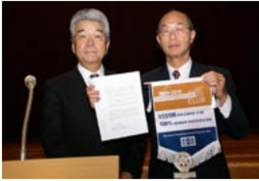
「財団の友」クラブ 100パーセントの表彰