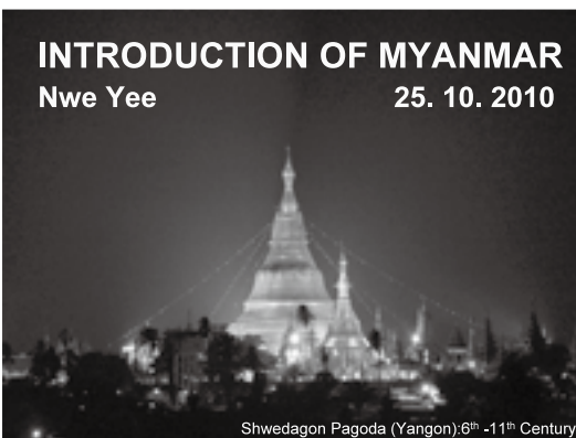
Shwedagon Pagoda (Yangon):6 th -11 th Century