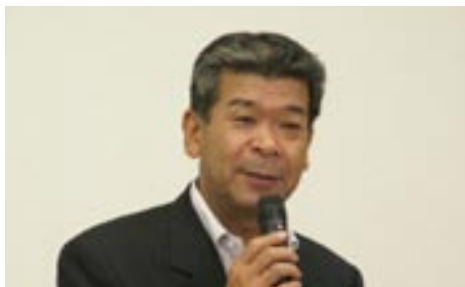
直前会長あいさつ