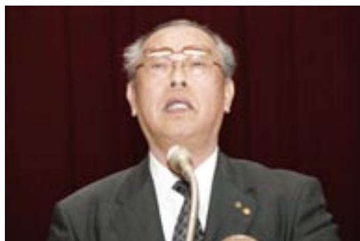
石原指名委員長あいさつ