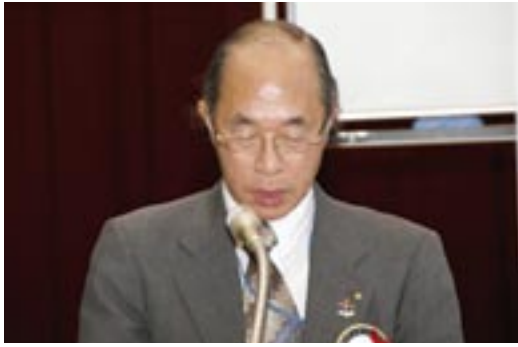
次期会長予定者あいさつ