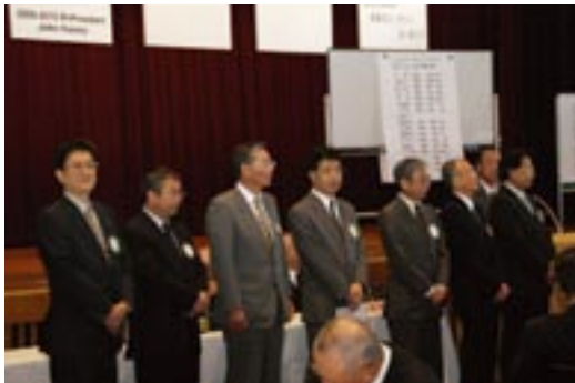
次年度理事・役員