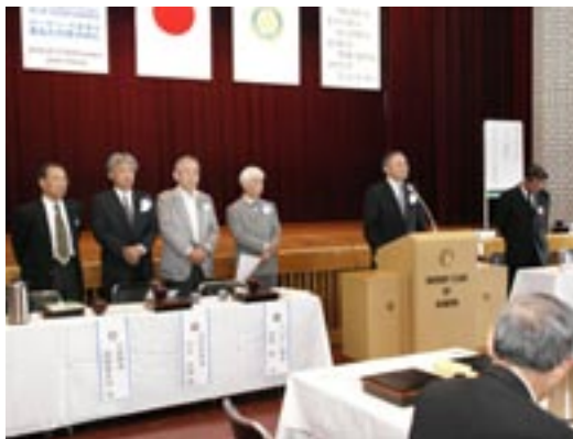
IM とガバナー補佐杯 PR