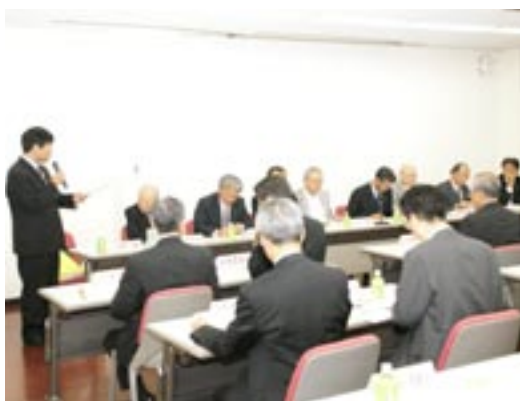
各委員長による委員会計画の発表とガバナー補佐のご指導