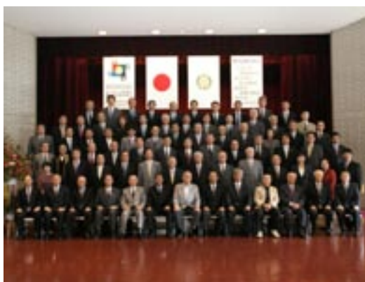
ガバナー補佐訪問集合写真

今回ガバナー補佐を任命され、いろいろと勉強させていただきました。益々のクラブの発展を祈念致しまして私の挨拶とさせていただきます。ありがとうございます。