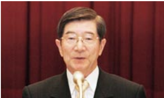
西三河分区分区大会 PR