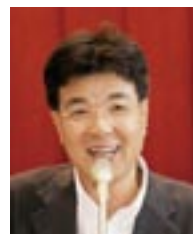
杉浦 芳一 ロータリー財団委員長